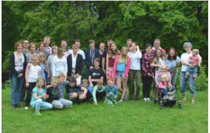
Familienkreis in Nideggen 2016

Wie gehen wir mit enttäuschter Hoffnung um oder mit Hoffnungslosigkeit? Dazu hat uns das gemeinsame Schauen des Kino-Filmes „Der kleine Prinz“ weitere durchaus sehr emotionale Momente beschert. Mit einem gemeinsam vorbereiteten und gestalteten Gottesdienst am Sonntagmorgen gingen die vier Tage zu Ende, die wieder einmal viel zu schnell vergangen sind.