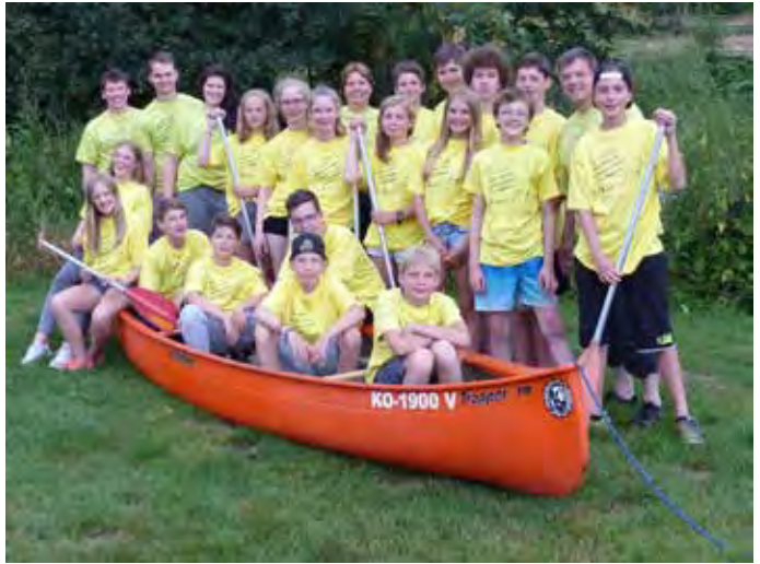
Kanu-Tour 2016