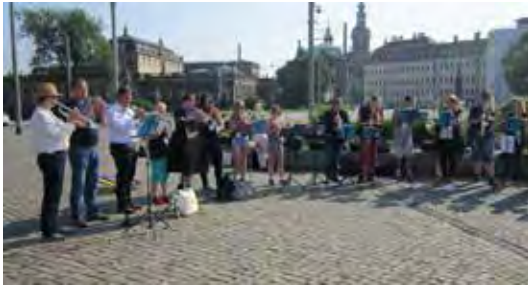
Posaumentag in Dresden

Los ging es freitags um 6.00 Uhr in einem komfortablen Reisebus. Das Ziel in Dresden haben wir um 13.30 Uhr erreicht. Nach der Zimmerverteilung im Hotel haben wir gemeinsam an der Eröffnungsveranstaltung mitgewirkt. Bei teilweise strömendem Regen fand diese auf zwei Plätzen der Stadt statt. Nach dem Abendessen und einem kurzen Besuch einer Veranstaltung auf dem Altmarkt haben wir den ersten Tag etwas erschöpft beendet.