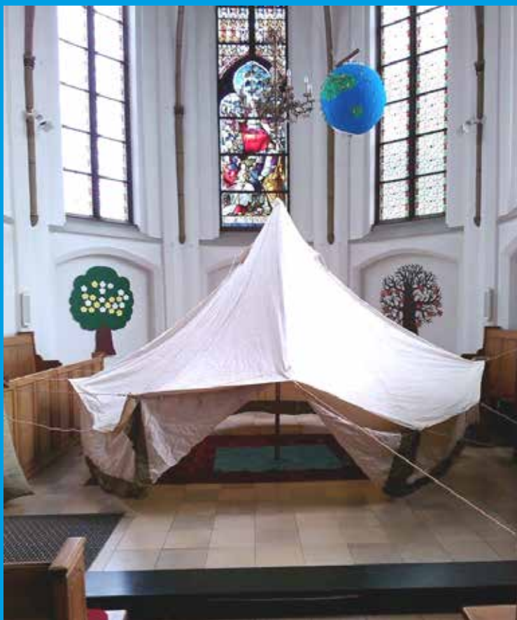
„Zu Besuch bei Abraham“ - Kindergottesdienst in Hamminkeln

Gemeindebrief der Evangelischen Kirchengemeinde Hamminkeln