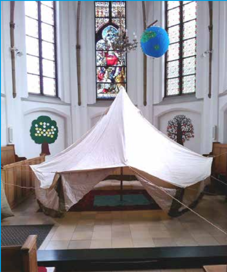
„Zu Besuch bei Abraham“ - Kindergottesdienst in Hamminkeln

Gemeindebrief der Evangelischen Kirchengemeinde Hamminkeln