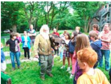
Falkner in Hinsbeck

Die Jugendherberge von Hinsbeck war inzwischen schon zum zweiten Mal Anlaufpunkt dieser Reise und bot die ideale Umgebung für eine Vielzahl von Aktionen. Nach einem Beginn nach Maß mit einem Feuerwehrspiel samt Spaß gab es noch viele weitere, spannende Aktivitäten: Discoabend für alle in der Jugendherberge, Kanutour im leichten Regen auf der Niers, Schnitzeljagd im Wald rund um die Jugendherberge, Nachtwanderung zu Fledermäusen, Besuch eines Falkners mit Falken und einem Steinadler, Grillfest mit Lagerfeuer und schließlich einem Public-Viewing des WM-Spiels gegen Ghana im Zirkuszelt.