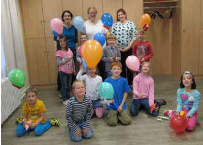
Kindergruppe mit selbstgebauten Zeppelinen

Kindergruppe: donnerstags 16.00 – 17.30 Uhr (außer in den Ferien), Ev. Gemeindezentrum