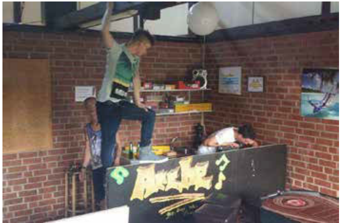
Graffiti auf der Theke in der ARCHE

Vor vielen Jahren waren bereits die Kinder und Jugendlichen an dem Um- und Aufbau der Räumlichkeiten beteiligt. So erschufen sie sich selbst einen Raum, der sich lohnt, besucht zu werden, Freunde einzuladen, es sich gemütlich zu machen und die Freizeit zu genießen.