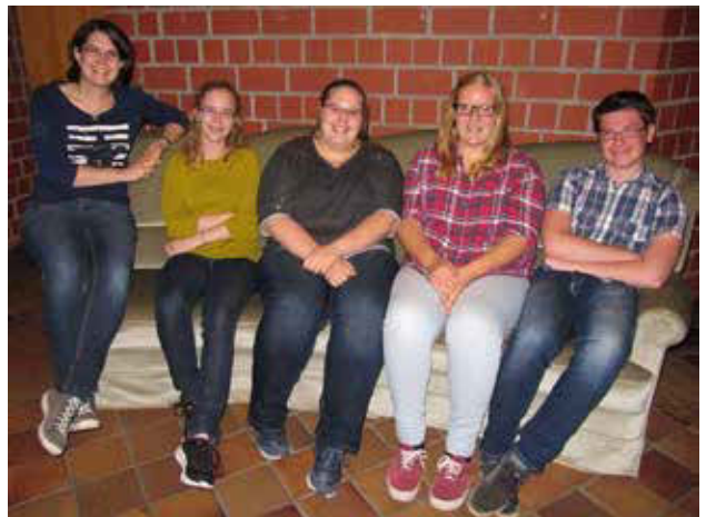
Kids Go - Team

atives genauso ihren Platz wie kindgerechte Geschichten und Gebete sowie Lieder zum Mitmachen.