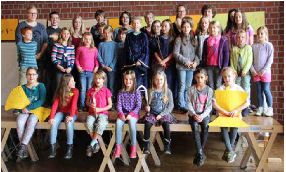
Teilnehmer Kindermusical „Rut“ im Herbst 2015

Ein Highlight der Woche ist stets die Aufführung des Musicals im Rahmen eines Gottesdienstes am Sonntag.