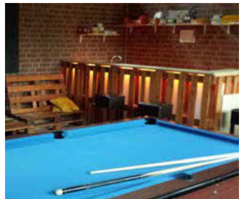
Theke im Jugendbereich ARCHE

Dabei ist es jedem freigestellt, an einem Projekt mitzuarbeiten oder seiner individuellen Freizeitgestaltung innerhalb der ARCHE nachzugehen, Gespräche zu führen, Musik zu hören oder gemeinsam Spiele zu spielen.