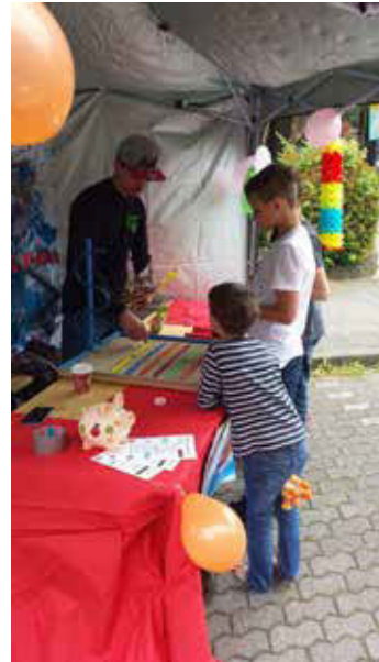
Stadtteilstfest Blumenkamp

der Freude zu vermitteln, die wir während unseren offenen Treffs gemeinsam haben.