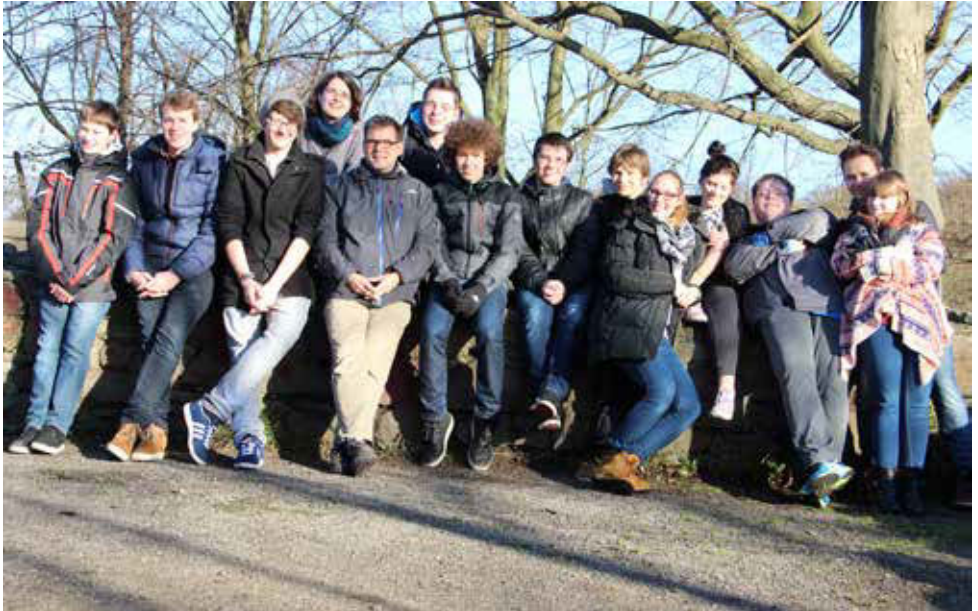
Jugendwochenende in Essen

ge“ nachgedacht. Außerdem haben wir die Alte Synagoge in Essen besichtigt, dort an einem Workshop teilgenommen, ein israelisches Fest gefeiert und so auch kulinarisches Neuland betreten. Abgerundet wurde das Wochenende mit jeder Menge Spielen und guten Gesprächen.