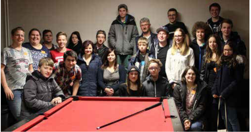
Teilnehmer „Perfektes Dinner“ in Isselburg