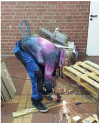
Arbeiten zum Umbau des Jugendraumes ARCHE

Ein neuer Wohlfühlort ist entstanden, den die Kinder und Jugendlichen mitgestaltet und erbaut haben. In Gemeinschaftsarbeit zwischen Kindern und Jugendlichen konnten alle den Umbau miterleben und mitgestalten, die daran teilhaben wollten. Wissen wurde weitergegeben, handwerkliches Können präzisiert und Freundschaften geschlossen.