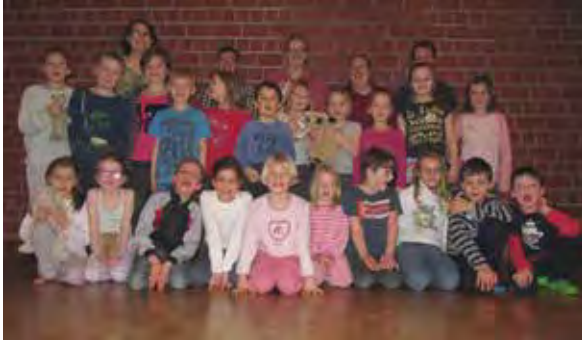
Kids-Gala-Night im Gemeindezentrum

21 Jungs und Mädchen nahmen an der Kids-Gala-Night teil.