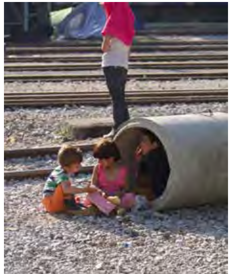
Momentaufnahme aus dem Flüchtlingscamp Idomeni an der griechisch-mazedonischen Grenze.