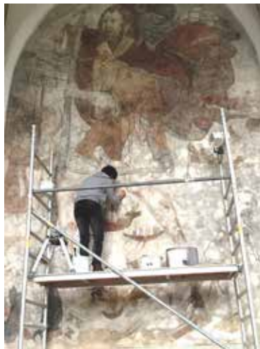
Restaurierung Christophorus