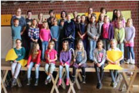
Kindermusical 2015